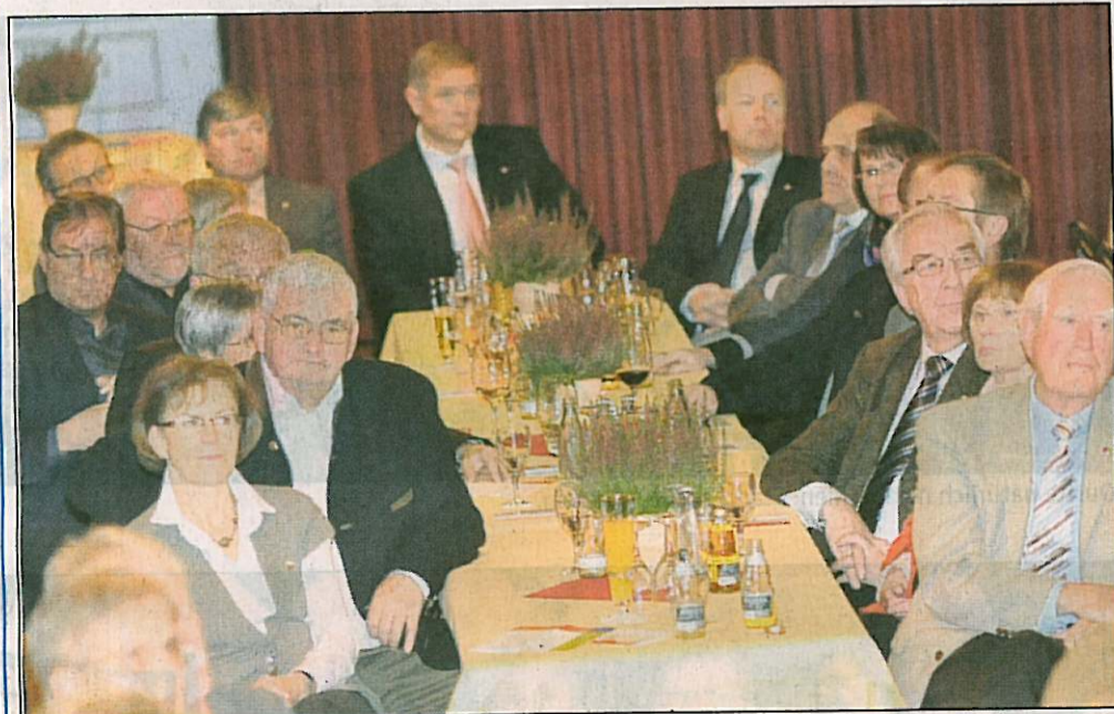
Der Besuch war gut beim Stiftungsfest im LWL-Festsaal. Nur ganz wenige Plätze blieben an diesem Abend unbesetzt.