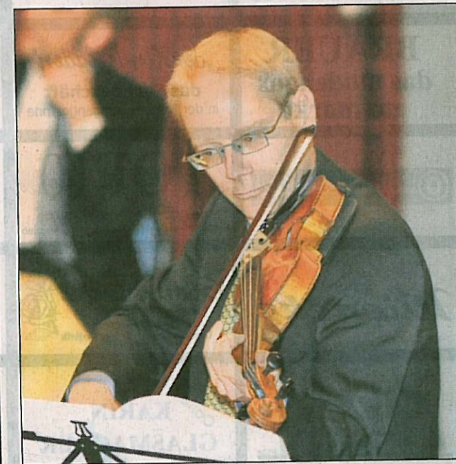
Die Musikschule Warstein unterhielt die Festgäste mit mehreren klassischen Musikstücken.